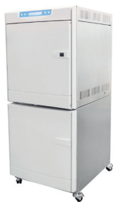
生物医学用 フリーザー