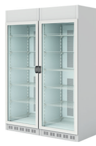
血液バンク 用冷蔵庫